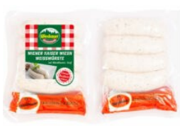
Wiesbauer bringt das Wiesn-Gefühl nach Hause