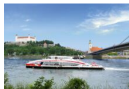
Leinen los: Der Twin City Liner ist zurück!